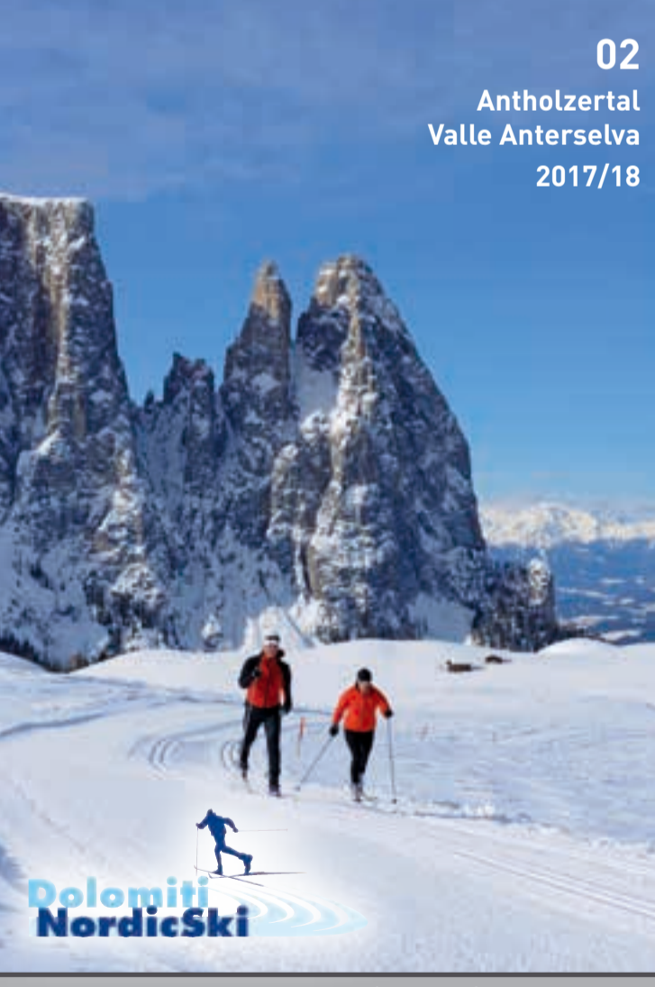
Loipenplan | Piste fondo | Cross country tracks

Dolomiti NordicSki Europe's largest cross-country skiing area ... in the Dolomites