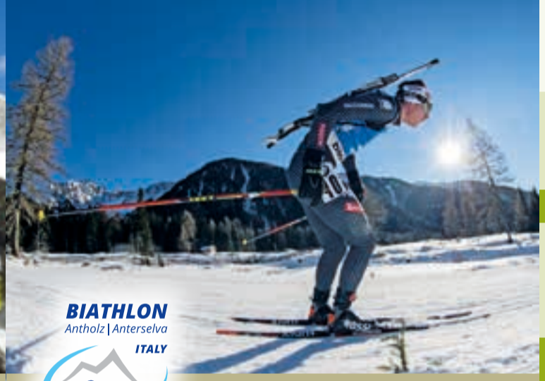
Biathlon Weltcup Komitee Comitato Coppa del Mondo Biathlon

Tel. + Fax +39 0474 492 446 www.langlauf-antholz.it - info@langlauf-antholz.it