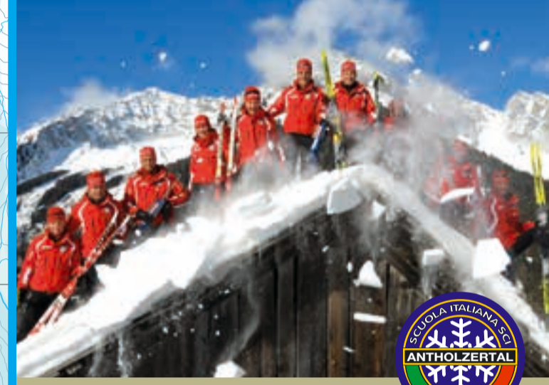
Langlauf- & Biathlonschule Antholztal Scuola Sci Fondo & Biathlon Anterselva